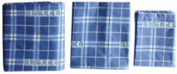
被套 被单 枕套

品名: 棉絮 型号: P04 成份: 面料100%棉, 填充物为二级棉胎, 重3斤, 规格: 0.9 x 2.0M