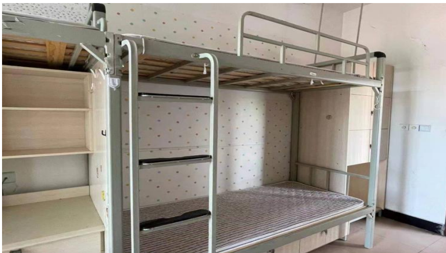
（需搬迁改造公寓床样式二）