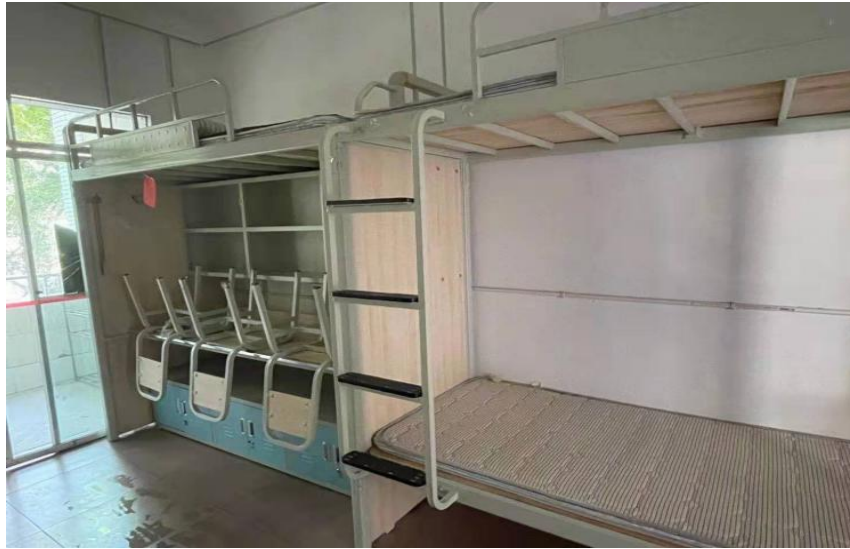
（需搬迁改造公寓床样式一）