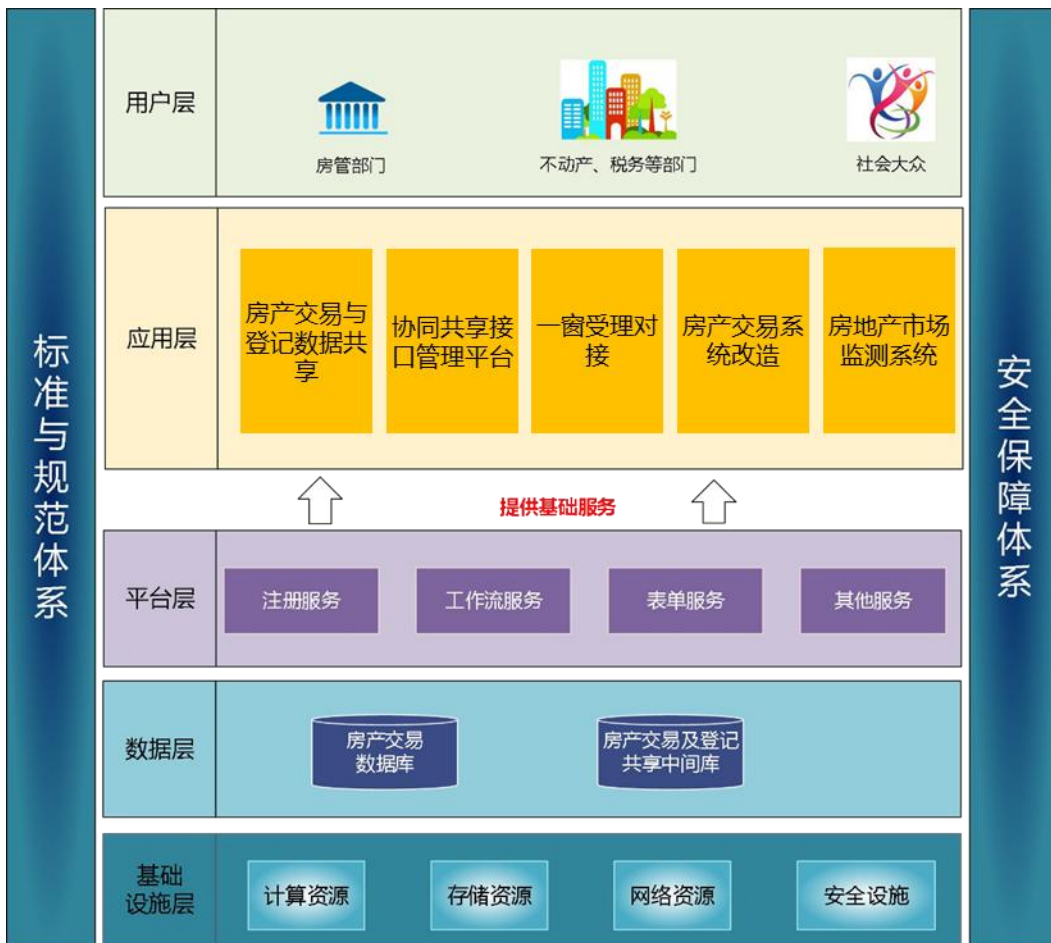
图 1 总体架构图

基础设施层： 包括房管部门的硬件基础设施环境，如计算资源、存储资源、网络资源、安全设施等。