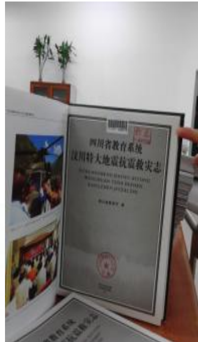
(图六：书名页馆藏章和样本章)