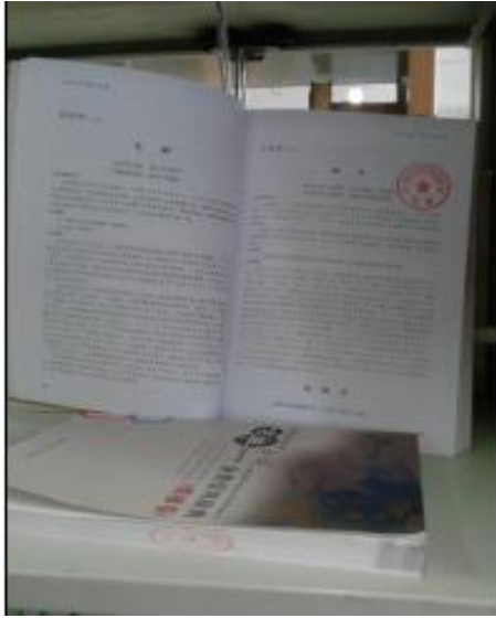
(图八：图书内任意页馆藏章)