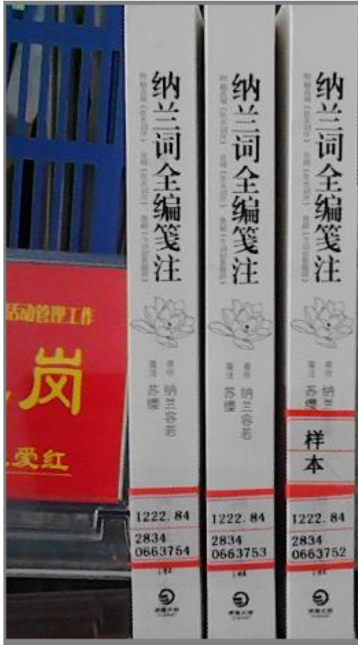
(图三：图书标签、样本书标签)