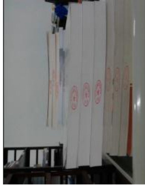
(图九：图书切口处馆藏章)