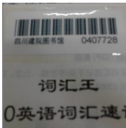
（图一：书名页条形码）