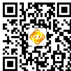
高德地图导航二维码